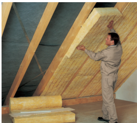
Dächer können von innen ...