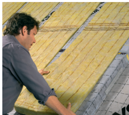
... oder von außen gedämmt werden. Die oberste Geschossdeckendämmung ist besonders lukrativ.