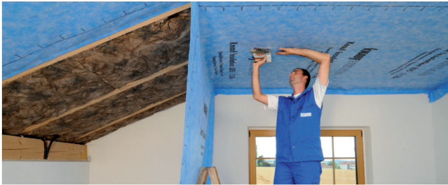
Wichtig ist immer ein luftdichter Abschluss der Dämmung zur Raumseite.